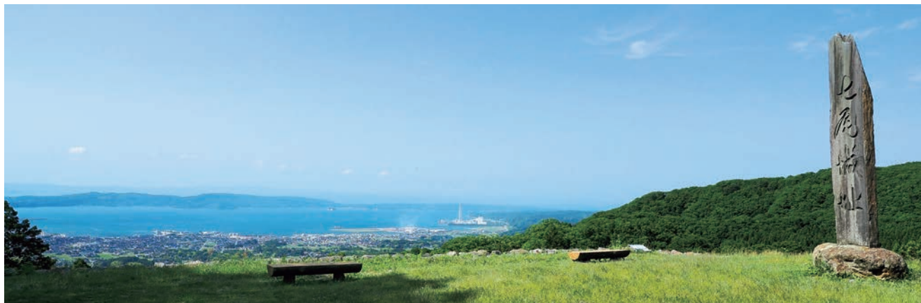
七尾城跡から見る七尾市街地と七尾湾

天正5年(1577)9月、天然の要害をもって堅固を誇った戦国大名能登畠山氏 ※1 の居城七尾城は、越後上杉謙信の攻略によって落城した。ここに室町・戦国期の能登で、170年間にわたり守護として領国支配を展開した畠山氏は滅亡する。それは同時に、北陸における戦国的世界の終焉を意味するものでもあった。