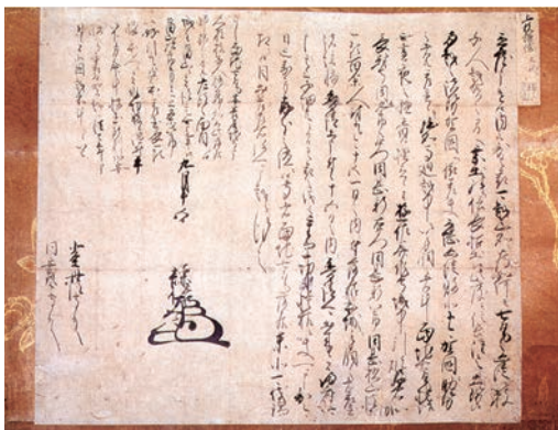
七尾落城を伝えた上杉謙信書状(甲府市 信玄公宝物館所蔵)

謙信は此の冬能登で越年し、七尾城の攻撃を続けたが、数千人の兵力をもって籠城し、頑強に抵抗を続ける七尾城の能登畠山氏方との間