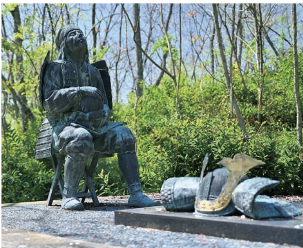
齋藤実盛の首を抱いて涙する木曾義仲像（加賀市手塚山公園）

実盛はかつて関東に在って源義朝 よしたも （頼朝の父）の郎従であった頃、義仲の父源義賢 よしかた （義朝の異母弟）が、甥の源義平 よしひら （義朝の長子）と争い殺害された折、幼い義仲を密かに信濃国木曾谷に逃した命の恩人であった。小松市の多太神社に所蔵される伝実盛着用の兜（国指定重要文化財）は、義仲が実盛の死を悼んで奉納したものと伝えられている。