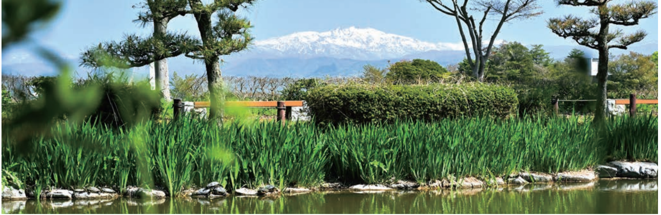
(斎藤実盛の首を洗ったとされる) 首洗池から望む白山連峰 (石川県加賀市柴山町手塚山公園)

源平合戦で名高い寿永2年(1183)5月11日の加賀・越中国境における倶利伽羅合戦 ※1 で、源(木曾)義仲の奇襲にあつて敗北した平氏軍は、石川郡宮腰(現金沢市金石町)の佐良嶽の浜まで退却して陣をとり、これを追撃して同郡平岳野(現金沢駅周辺)の木立林に布陣した義仲軍と対峙した。