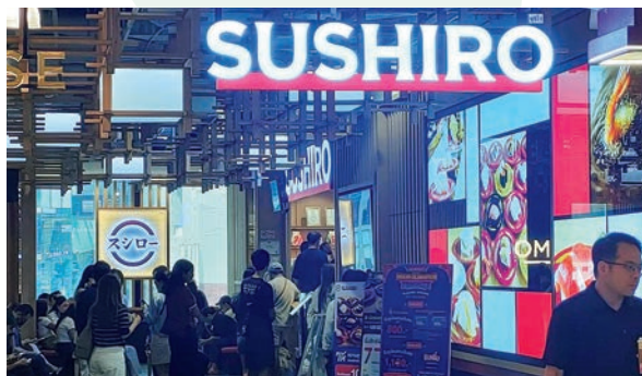
ランチタイムのバンコク市内スシローの様子

訪日タイ人が今後も増えるようであれば、タイの日本食レストランにおける「高級店」の淘汰が進む一方で、中間・庶民層の厚い支持を受ける「中・低価格帯」が底堅く推移するという傾向が続くかもしれません。