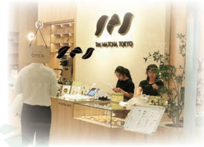
バンコク市内の抹茶専門店